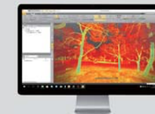
LiDAR 360 UAV 搭載 LiDAR で計測した 3D データの解析等のシステム