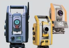
各種 トータルステーション