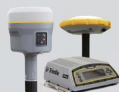
各種 GNSS 機

リーグル社製のリーグルミニヘッドと IMU に APX-20 を搭載した高精度モデル