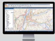
TOWIES 測量 CAD から 3D 処理まで