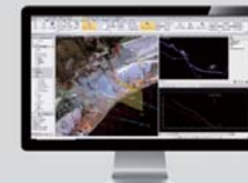
Trimble Business Center 3D 最新オフィスソフト