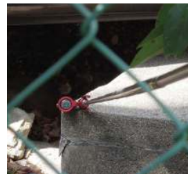
フェンス越しの観測