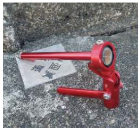
境界プレートの観測

自立させての使用はもちろん、伸縮シャフト「CPS-115/CPS-150」や伸縮ピンポール「CP-565 / SP-900」と組み合わせることにより、手では届かない「フェンス越えの建物角」や、オフセットピンを併用することによりプリズムが入らない奥まった箇所なども簡単に、しかも正確に測距することが可能です。